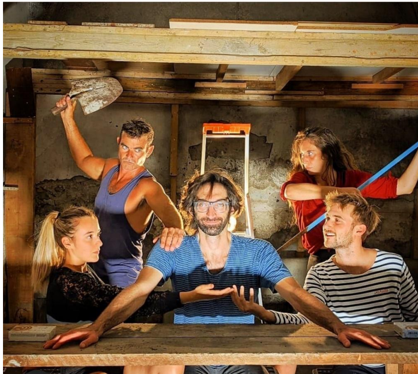
Le collectif La Machine à la Villa Victorine en résidence – Septembre 2021

La villa Victorine, véritable pépinière artistique temporaire, vouée à disparaître pour la construction d'un projet d'avenir ambitieux, restera un vivier artistique où les dispositifs créatifs se mêlent et se succèdent.