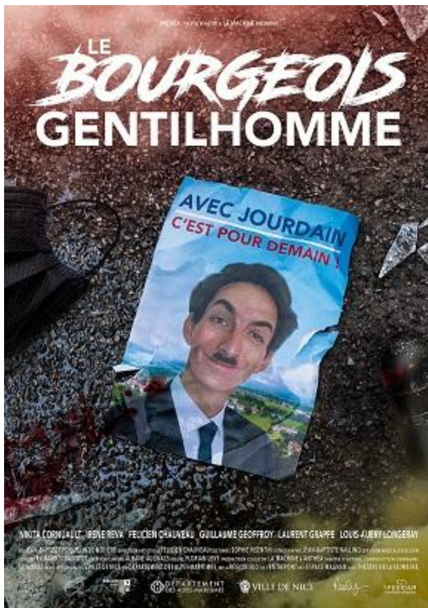
Le Bourgeois Gentilhomme – Image Florian Levy