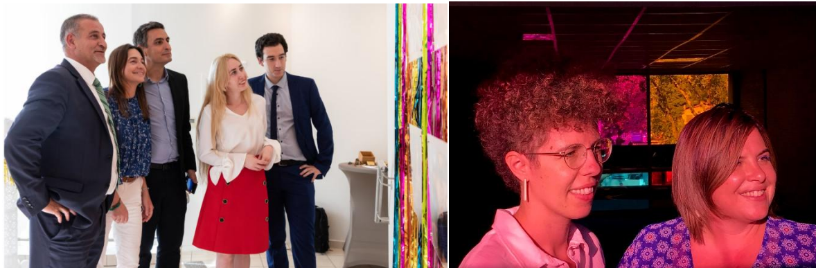
Salle d'attente "Road Movie, Caisse d'Epargne Masséna, 2019, photo Driss Hadia / ENTRE|DEUX chez Resistex, photo Éric Michel, 2021.

ENTRE|DEUX | se définit comme un programme d'expositions et d'évènements mené entre deux commissaires d'expositions.