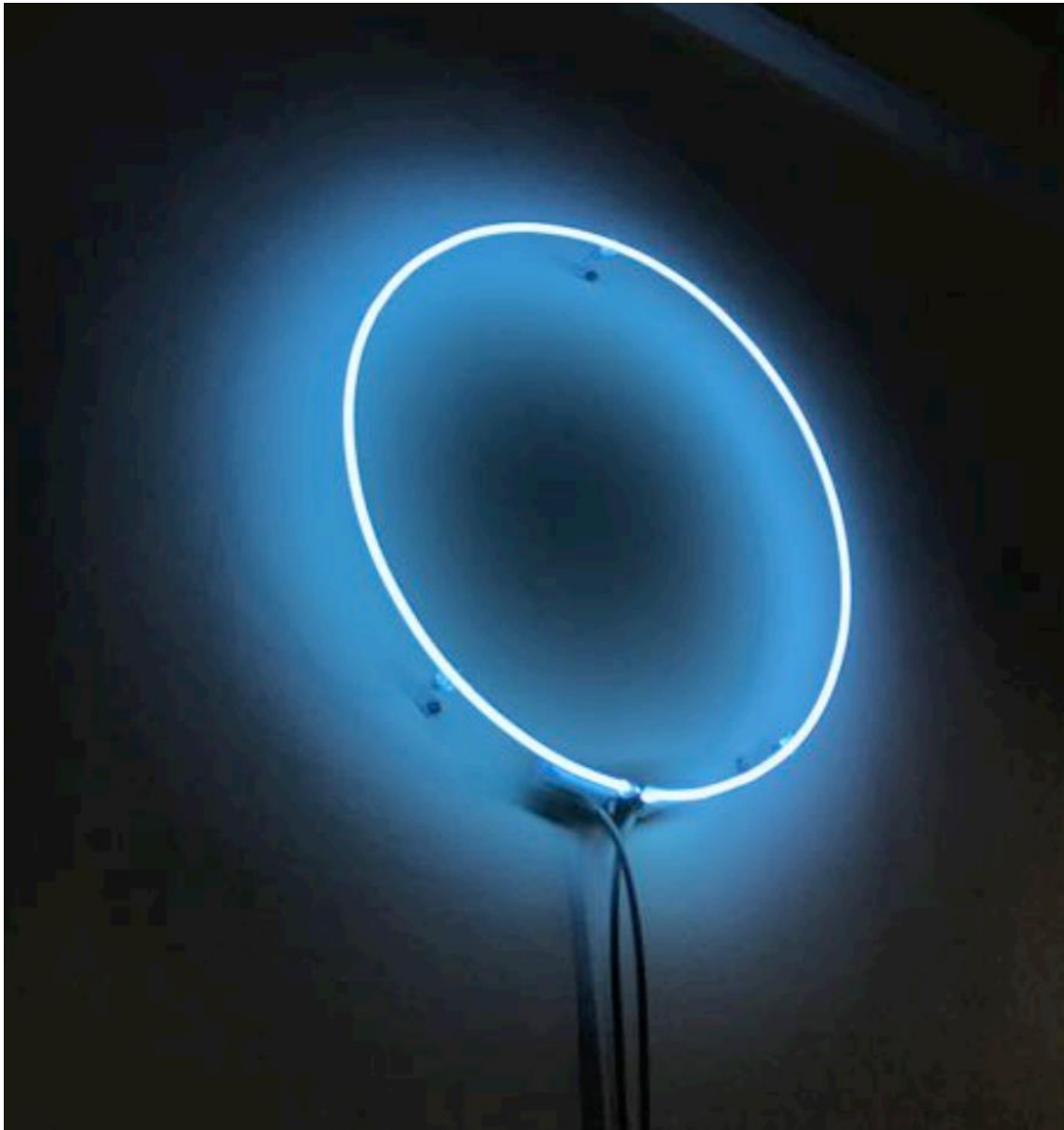
Luz Azul, 2020