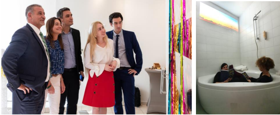
Salle d'attente "Road Movie, Caisse d'Epargne Masséna, 2019, photo Driss Hadia / ENTRE|DEUX dans une chambre de l'hôtel Windsor, Nice, 2019.

ENTRE|DEUX se définit comme un programme d'expositions et d'évènements mené entre deux commissaires d'expositions.