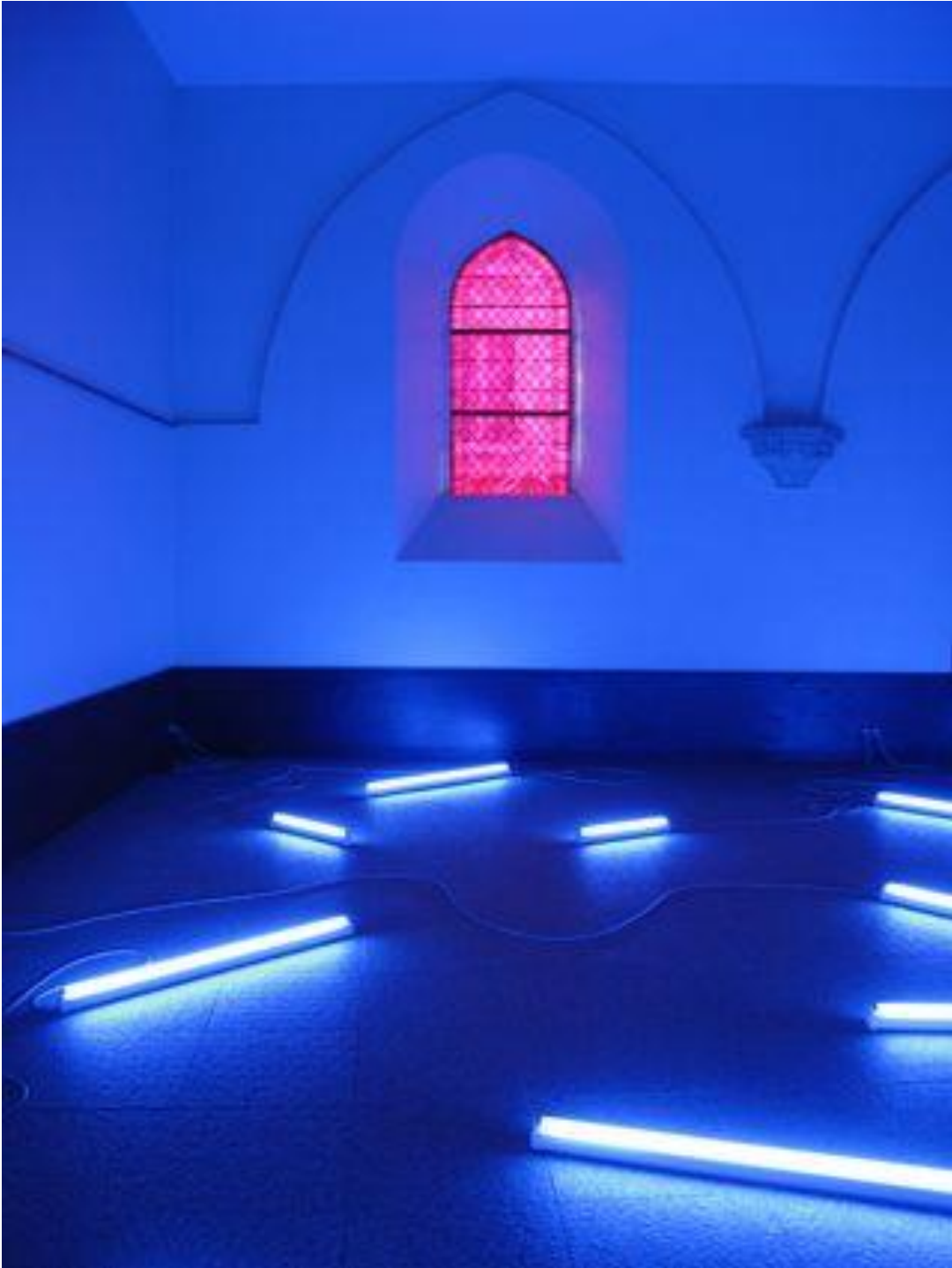
Collégial Saint-Lazare, Avallon, 2011