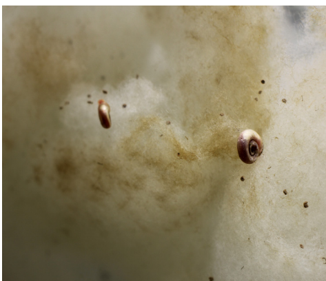
© Camille Franch-Guerra et ADAGP Courtesy La station

Diapason cristal, planche de bois de pin, contenant en verre, diapason cristal, Tradescantia pallida