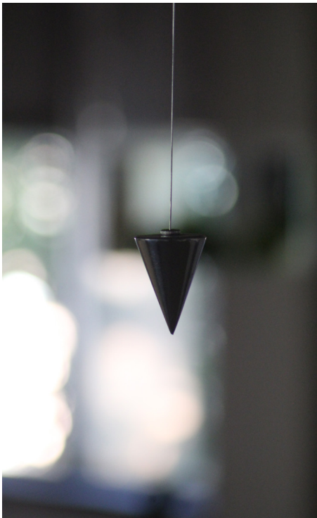
© Camille Franch-Guerra et ADAGP Photo Clara Holuigue