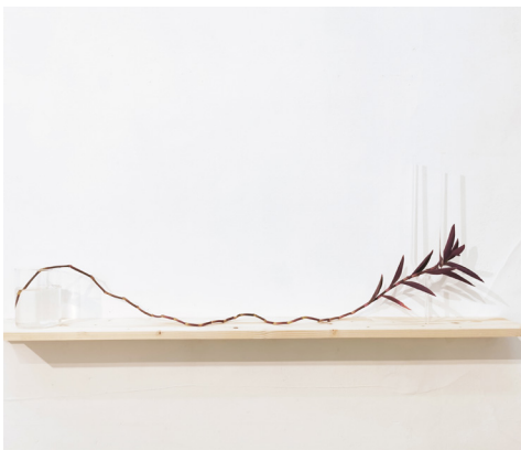
© Camille Franch-Guerra et ADAGP Photo François Fernandez Courtesy Eva Vautier

Dalle de led 4800k°, cadre de balsa et encre de chine, socle métal recouvert de charbon, plaque de verre anti uv et reflet recouvert de feuille d'or, coquillage thalassiarachus, fil de cuivre, porcelaine bone china, structure d'horloge en laiton et verre, poussière d'astéroïde provenant du cratère de Chicxulub, étain, miroir rond ambré, tige de laiton, Tube en verre contenant des micro-organismes