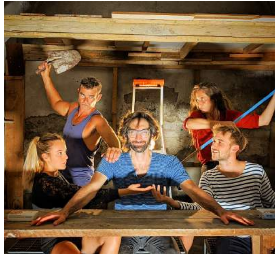
La Machine, Bourgeois Gentilhomme, 2021.