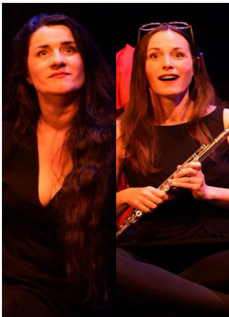
Nathalie Masségia | Gwenn Masségia