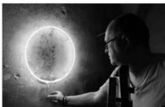
© Eric Michel Photo Patrice Mazzi

En collaboration avec ENTRE|DEUX depuis l'été 2021, l'entreprise RÉSISTEX accueille des artistes dans ses murs autour d'un projet de création et d'échange avec les salarié.e.s, prolongeant les valeurs éco-responsables et du bien-être au travail de l'entreprise.